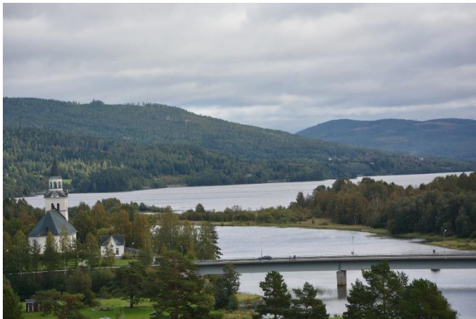
Utsikt över Stöde kyrka och Ljungan från Huberget