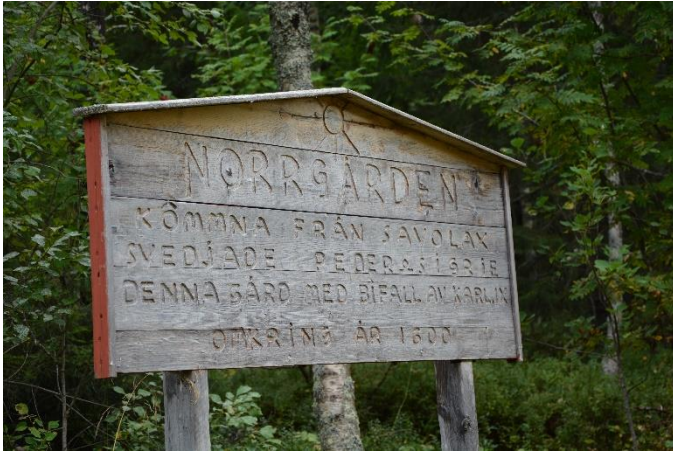
Norrgårdens vackra träskylt i Kölsjön