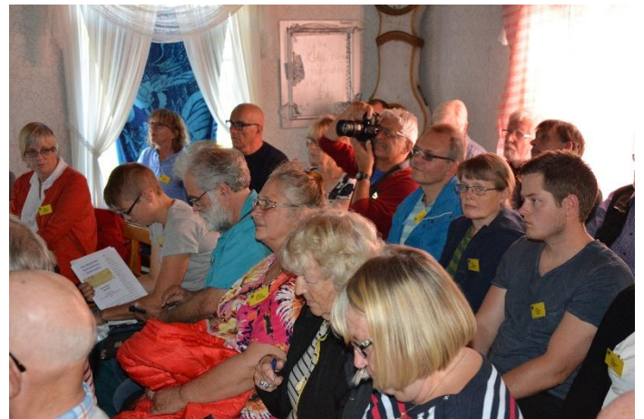
Konferensdeltagare inne i Nedansjögården