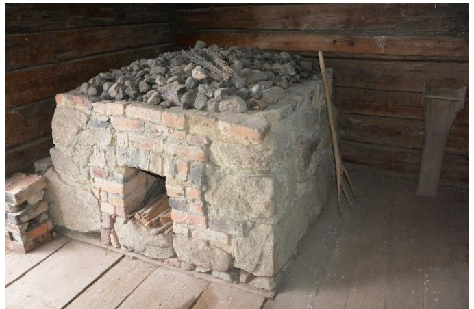
Den unika ugnen och trägreppen i Söderåsens ria

Till sist vill jag å FINNSAM:s vägnar tacka de bidragsgivare som såg till att konferensen kunde genomföras till ett mycket rimligt pris: Länsstyrelsen Västernorrland, Arrangörslyftet Västernorrland, Region Gävleborg, Landstinget Västernorrland, Sundsvalls kommun (såväl i form av själva kommunen som det finska förvaltningsområdet) och SCA!